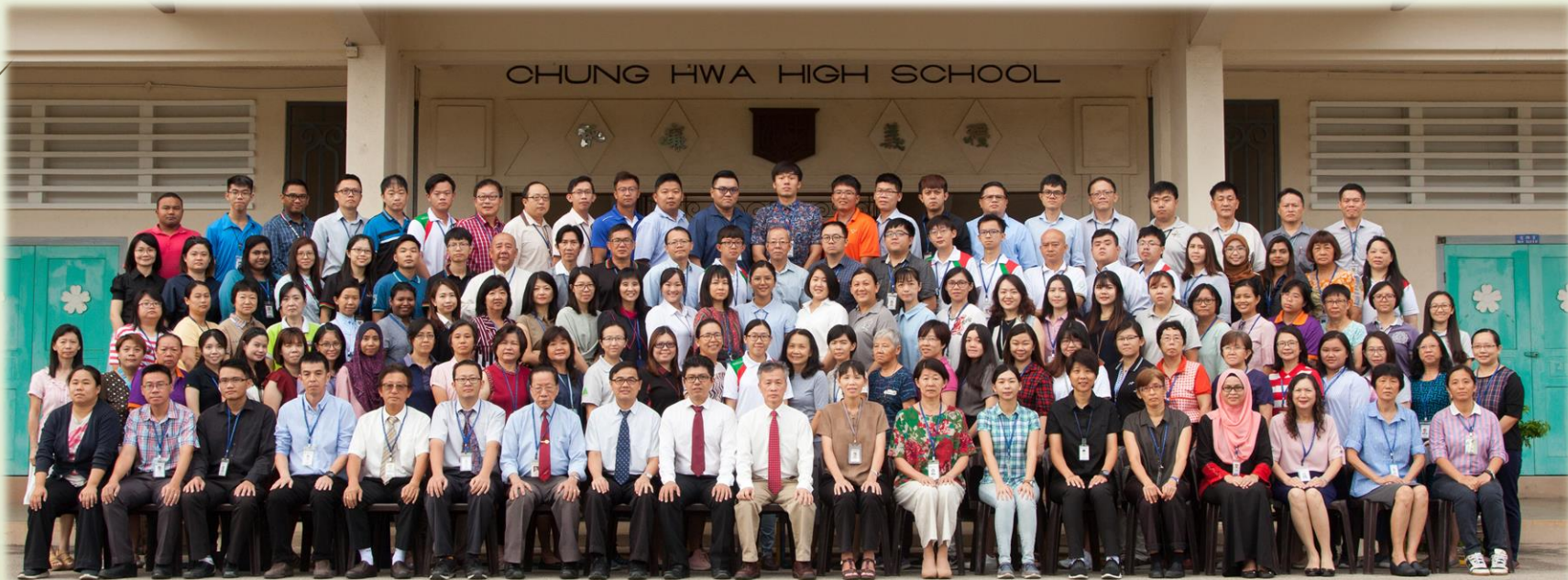
2019年麻坡中化中學全體教職員合照